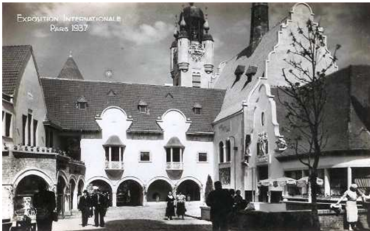
Le pavillon Flandre-Artois réalisé par les architectes Morel, Quetelard et Barbotin, dans le Centre régional de l'Exposition des arts et techniques de la vie moderne à Paris en 1937.