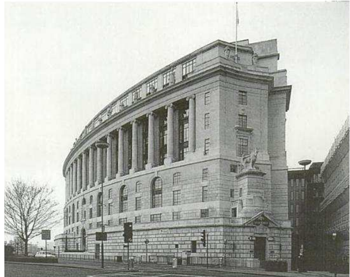
A gauche : J.J. Burnet, Kodak House, Londres, 1920-25. A droite : J.J. Burnet, Unilever House, Londres, 1930-32.