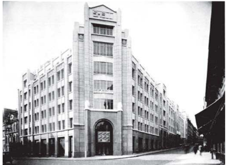
A gauche : A. et G. Perret, Immeuble d'habitation rue Raynouard, Paris, 1932. A droite : L. Bechmann, Immeuble Shell, Paris 1929-32.