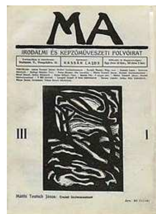
De gauche à droite : Revue Dada, Zurich, 1917-1921. Revue Documents, Paris, 1929-1934. Revue MA, Budapest, 1916-1919, Vienne 1919-1925.