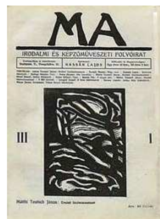
De gauche à droite : Revue Dada, Zurich, 1917-1921. Revue Documents, Paris, 1929-1934. Revue MA, Budapest, 1916-1919, Vienne 1919-1925.