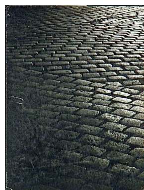
De gauche à droite : Georgia O'Keeffe, City Night, 1926, h/t, 122 x 76 cm, The Minneapolis Institute of Arts; Victor Brauner, La Ville qui rêve, 1937, h/b, 14 x 18 cm, Paris, MNAM; Brassaï, Les Pavés, vers 1930-1932, épreuve argentique, 24 x 18 cm, Paris, Estate Brassaï.

Nous vous attendons nombreux pour débattre avec nous.